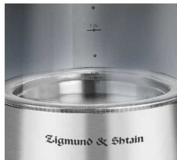
Закрытый дисковый стальной нагревательный элемент