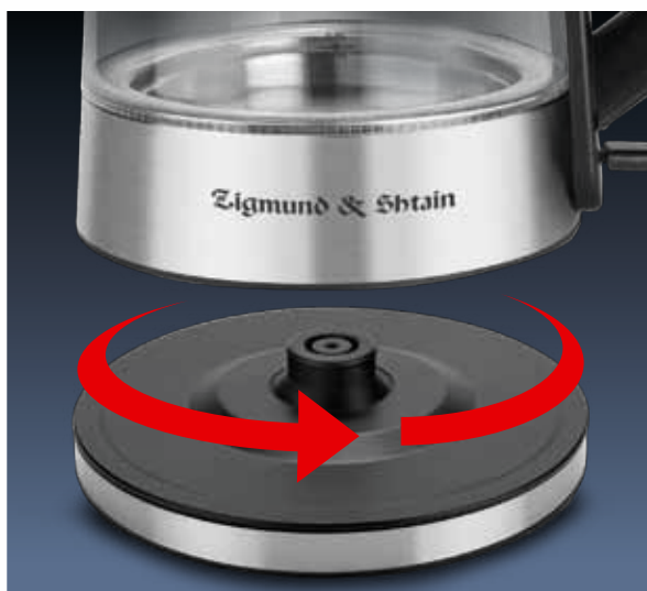
Поворотная база на 360°